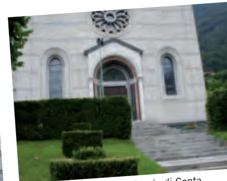
MASLIANICO, con il santuario di Santa Teresa del Bambino Gesù di Lisieux