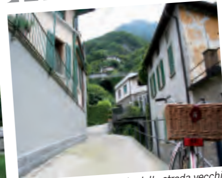
LAGLIO, con uno scorcio dalla strada vecchia Regina Teodolinda