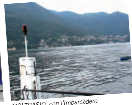
MOLTRASIO, con l'Imbarcadere