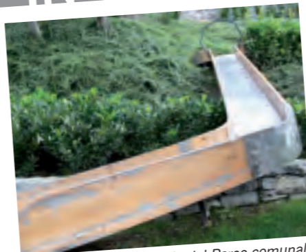
BRIENNO, con lo scivolo del Parco comunale