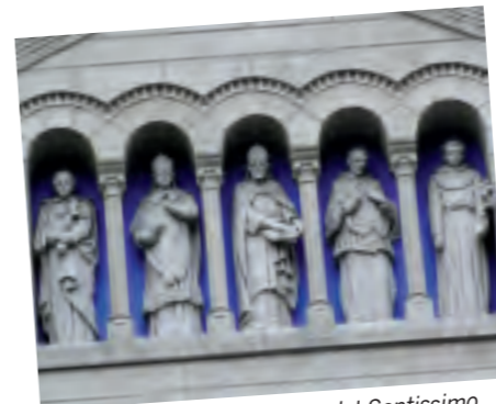
CERNOBBIO, con la chiesa del Santissimo Redentore